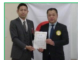
青年会議所より委嘱状

◎横須賀ロータークラブより「10,000 プラト フォート クリーン作戦」のご案内