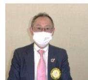
金井 副 SAA