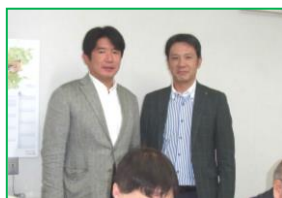
誕生日祝 前川永久会員

ニコニコBOXの合計は12,000円(累計419,000円) ご協力有難うございました。次週も宜しくお願い致します