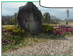
県立相模三川公園