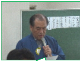
出席報告 鶴山信行例会担当

ニコニコBOXの合計は6,000円(累計76,000円) ご協力有難うございました。次週も宜しくお願ひ致します